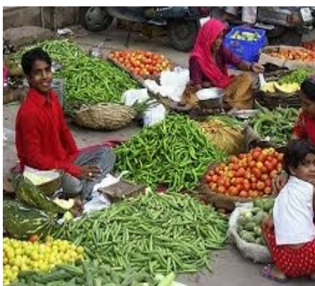
Υπαίθρια αγορά λαχανικών

τομέα της Άμυνας, των κατασκευών, της πολιτικής αεροπορίας κλπ. Οι ΑΞΕ θεωρούνται κρίσιμη σημασίας για την Ινδία, η οποία χρειάζεται περίπου $ 1 τρις επενδύσεις από το εξωτερικό τα επόμενα πέντε χρόνια για τη βελτίωση των υποδομών της, έτσι ώστε να δοθεί περαιτέρω ώθηση στην ανάπτυξη.