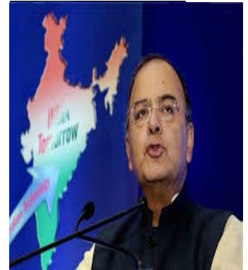
Ο Υπουργός Οικονομικών της Ινδίας, κ. Arun Jaitley

επενδύσεις και ότι όλες προσπαθούν να αντιμετωπίσουν τις συνέπειες της παγκόσμιας οικονομικής επιβράδυνσης, έτσι ώστε η Ινδία να παραμείνει οικονομία εν κινήσει. Κατέληξε λέγοντας, ότι η Κεντρική Κυβέρνηση συνεργάζεται εξίσου με όλες τις τοπικές κυβερνήσεις, καθώς η ανάπτυξη των επιμέρους κρατιδίων σημαίνει μεγέθυνση του εθνικού προϊόντος, ενώ τόνισε ότι μια από τις μεγαλύτερες προκλήσεις προέρχεται από τον γεωργικό τομέα, που κατέγραψε σημαντικές απώλειες τα τελευταία δύο έτη λόγω των ανεπαρκών μουσώνων.