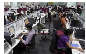
Υπάλληλοι ινδικής εταιρείας πληροφορικής

μονάδες τον Δεκέμβριο, γεγονός που αποδεικνύει την ταχεία ανάκαμψη της Μεταποίησης μετά τις καταστροφικές πλημμύρες στο κρατίδιο Ταμίλ Νάντου ένα μήνα νωρίτερα.