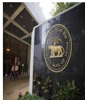
Αποθεματική Τράπεζα της Ινδίας

να συγχωνευτούν, προκειμένου να βελτιστοποιήσουν τη χρήση των πόρων τους. Σε αυτά τα πλαίσια η Αποθεματική Τράπεζα ζήτησε από τις τράπεζες την αναθεώρηση ορισμένων δανείων και την κατηγοριοποίησή τους σε δύο τρίμηνα (31 Δεκεμβρίου 2015 και 31 Μαρτίου 2016).