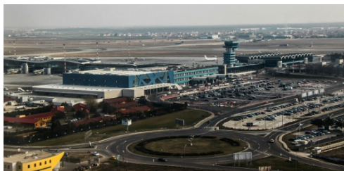
Αφίξεις Ρουμάνων τουριστών στην Ελλάδα

Σύμφωνα με στοιχεία της Τράπεζας της Ελλάδος, κατά το 2017 αφίχθησαν στην Ελλάδα 1.149.000 τουρίστες από την Ρουμανία έναντι 1.026.000 το 2016, καταγράφοντας αύξηση της τάξεως του 12%. Βάσει εκτιμήσεων επαγγελματιών του κλάδου (Ένωση Τουριστικών Πρακτόρων Ρουμανίας-ANAT), το 2017 η Ελλάδα απετέλεσε και πάλι τον πρώτο προορισμό Ρουμάνων τουριστών, ενώ ο τελικός όγκος τουριστών ξεπέρασε τα 1.300.000 άτομα, συμπεριλαμβανομένου του αριθμού των τουριστών που μετακινούνται με ναυλωμένες πτήσεις (charter) κατά τους θερινούς μήνες και αυτών που ταξιδεύουν με ίδιο μέσο.